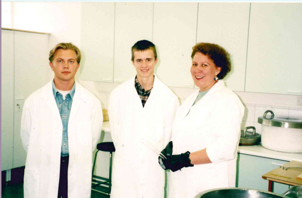
Ylemmässä kuvassa istun laboratoriotöistössäni tietokoneen ääressä. Alemmassa olen Petroskoin yliopistoharjoittelijoiden kanssa laboratoriossa.